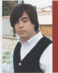
F. Javier Moreno Ajuntament de Navarres